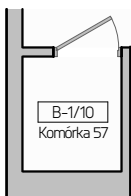
Komórka lokatorska POZIOM -1